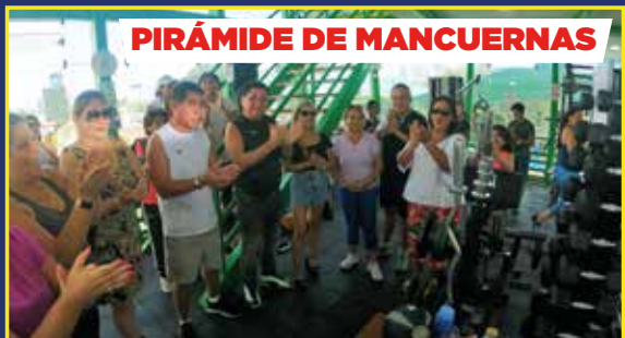
PIRÁMIDE DE MANCUERNAS