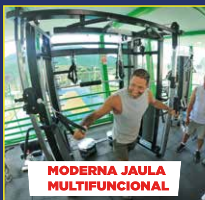
MODERNA JAULA MULTIFUNCIONAL